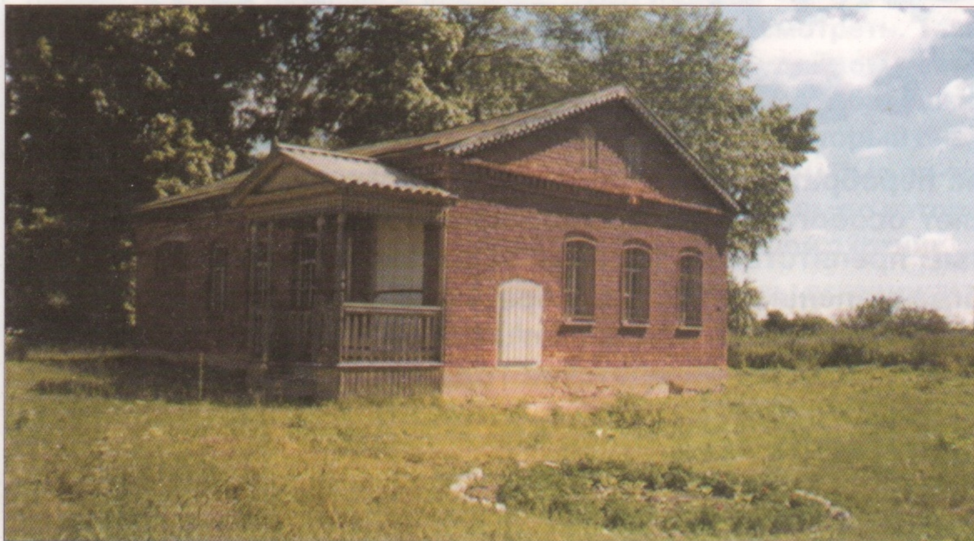
В имении Аксаковых (бывшая конюшня).

Они разговорились, и Сережа рассказал нашему путешественнику, как интересно он проводит время. Про то, как вчера, когда всем семейством Аксаковы отправились по грибы, они видели зайца вот с такими огромными ушами и чудесными блестящими глазками. А потом им повезло еще больше: нашли нору, около которой играли маленькие лисята. Рассказал своему новому другу Сережа и о том, как весело купаться и удить рыбу в речке Майне и какая вкусная и чистая вода в Белом ключе. Потом Сережа извинился и побежал вновь за своей бабочкой.