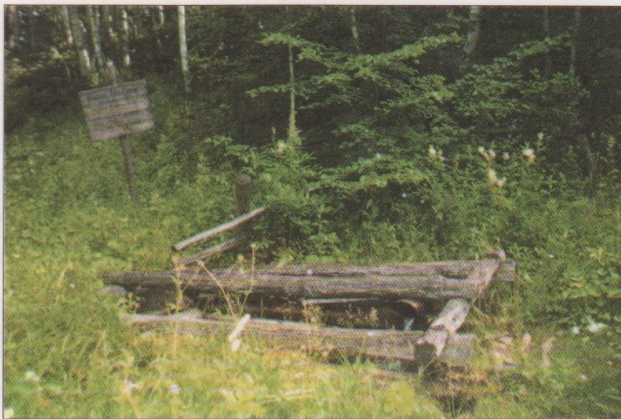
Колодец в Аксаково помнит своих хозяев.