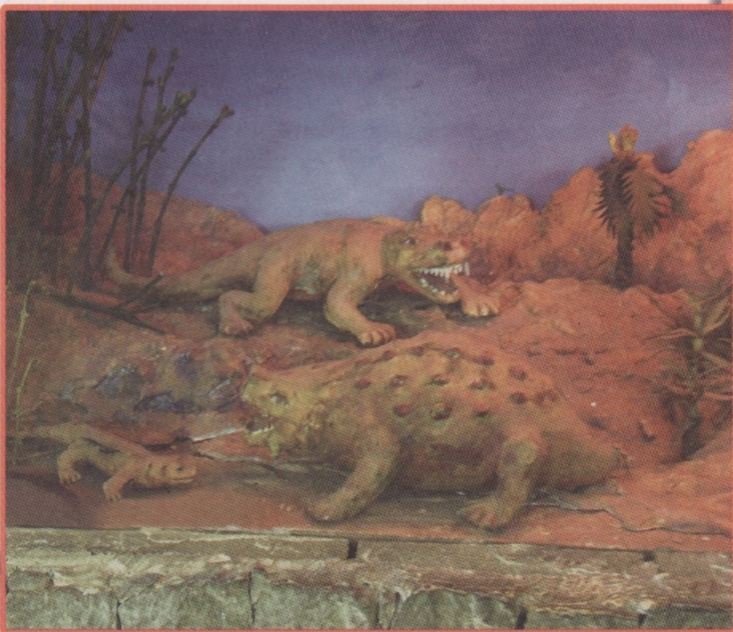
Ланшафт Триасового периода. ▲

От той эпохи в коллекции музея сохранились раковины аммонитов, скелеты и иглы древних морских ежей, кораллы, губки и, конечно, то, что осталось от древних морских чудовищ.