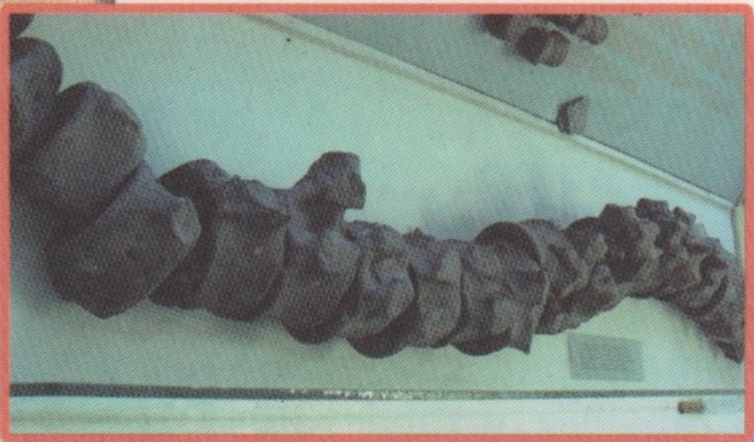
▲ Позвоночник плезиозавра.