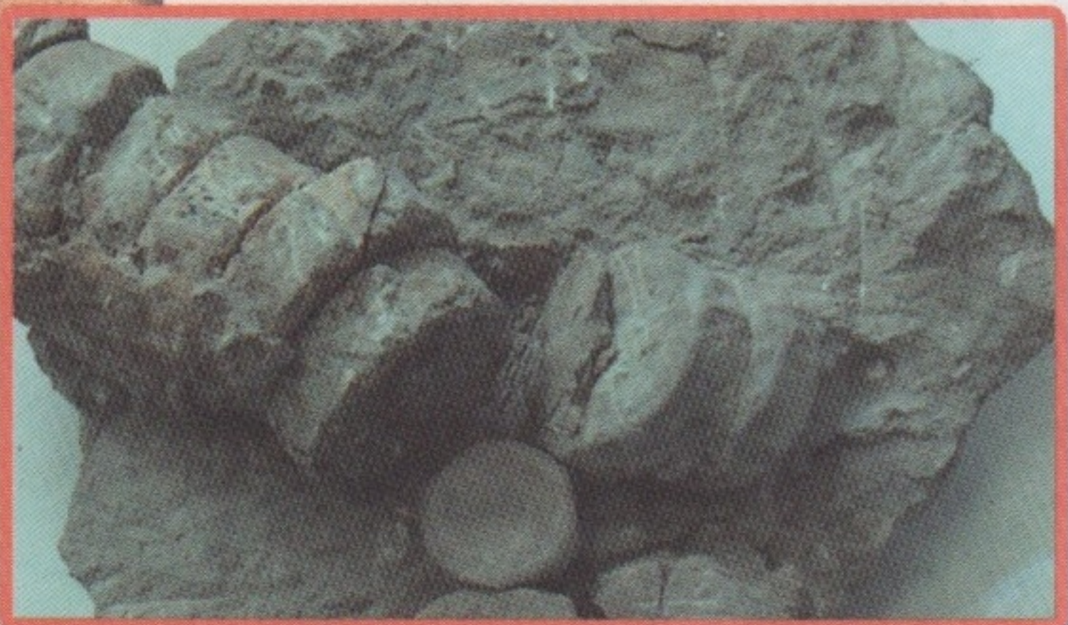
Позвонки ихтиозавра. ▲