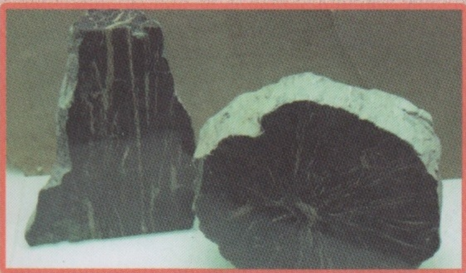
▲ Окаменевший кипарис.